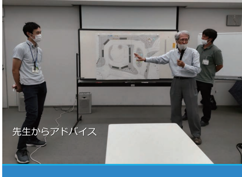
先生からアドバイス